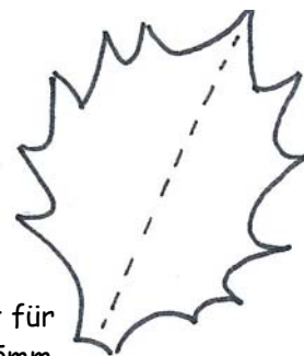
Ilexblatt für 35mm - 45mm Pompom