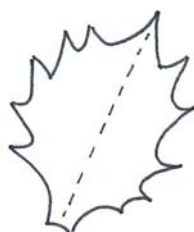
Ilexblatt für 25mm Pompom