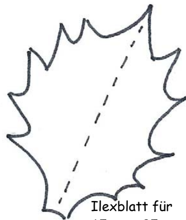
Ilexblatt für 65mm - 85mm Pompom